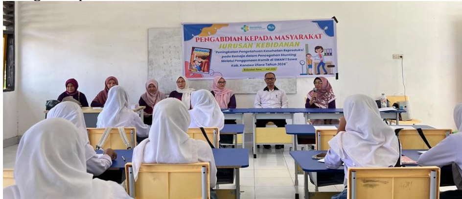
Gambar 3. Pembukaan Kegiatan

Tahap pelaksanaan dilakukan tanggal 9 dan 14 Agustus 2024. Pada tanggal 9 Agustus 2024 dilakukan pembukaan kegiatan oleh Kepala SMAN 1 Sawa dan selanjutnya peserta dibagikan kuesioner untuk diisi kemampuan awalnya terkait kesehatan reproduksi terutama bahaya pernikahan dini dan stunting. Peserta sejumlah 30 orang diberikan penyuluhan dengan bantuan komik edukasi sebagai oleh Tim Pengabdian. Pada akhir kegiatan peserta diminta untuk membaca kembali komik di rumah.