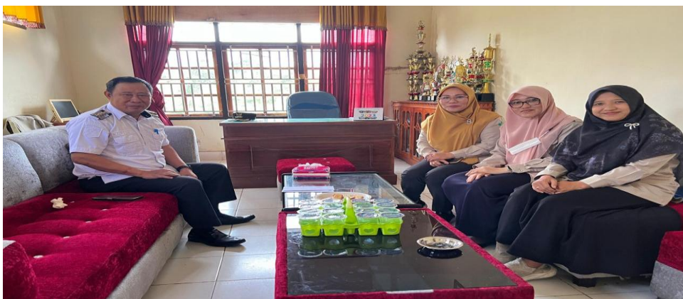
Gambar 2. Tahap Advokasi

Tahapan advokasi adalah serangkaian kegiatan yang meliputi perizinan dan mendapatkan dukungan kerjasama dengan pihak terkait. Pada tahap ini Tim Pengabdian telah melakukan advokasi dengan Kepala Kecamatan Sawa dan Kepala SMAN 1 Sawa yang diwakili oleh Guru dikarenakan pada saat kegiatan kepala sekolah sedang memiliki kegiatan lain. Kegiatan advokasi dilaksanakan tanggal 4 Agustus 2024.