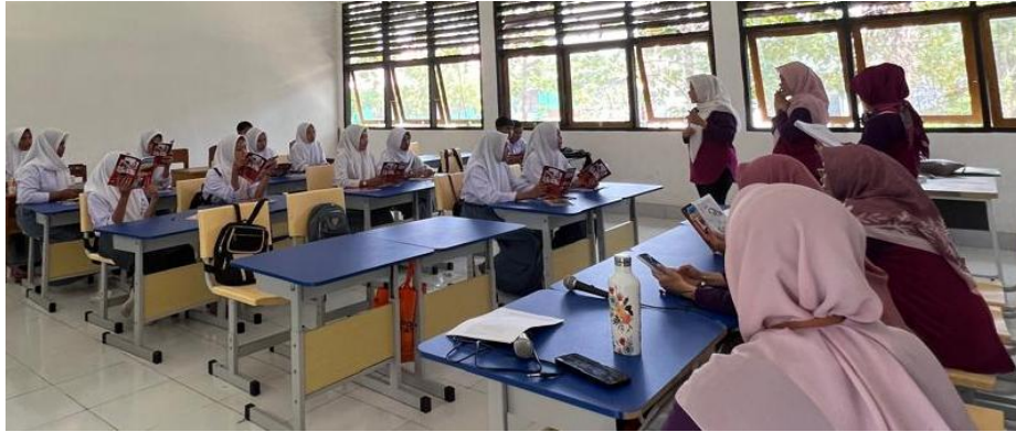
Gambar 6. Pemberian Edukasi