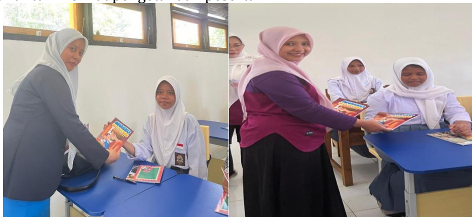
Gambar 5. Pembagian Komik

Kegiatan pada tanggal 14 Agustus 2024 adalah melakukan refleksi pada peserta dengan menanyakan terkait komik yang telah dibaca serta pengisian kembali kuesioner untuk melihat pengetahuan peserta.