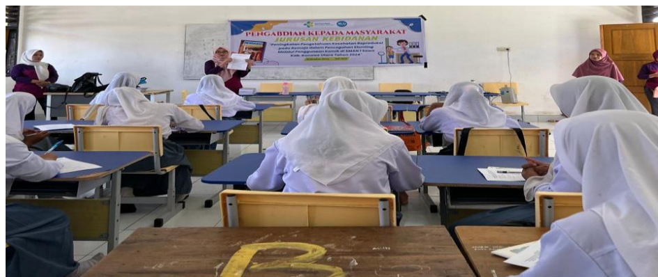
Gambar 4. Penjelasan Pengisian Kuesioner

Kegiatan pada tanggal 14 Agustus 2024 adalah melakukan refleksi pada peserta dengan menanyakan terkait komik yang telah dibaca serta pengisian kembali kuesioner untuk melihat pengetahuan peserta.