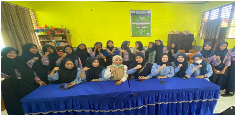
Gambar 7. Pelaksanaan Tanggal 14 Agustus 2024