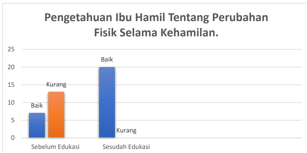
Gambar 2 Grafik Pengetahuan Ibu Hamil

Pada tabel 2, sebelum edukasi pengetahuan ibu hamil Sebagian besar pada kategori kurang dan setelah edukasi pengetahuan ibu hamil seluruhnya pada kategori baik.