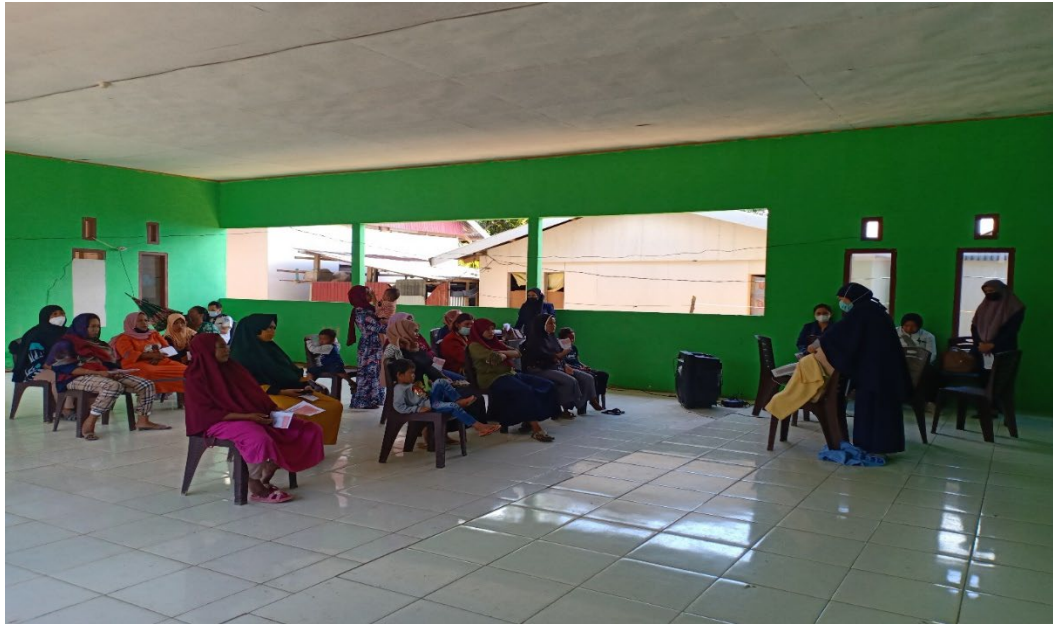
Gambar 5. Kegiatan demonstrasi perawatan payudara