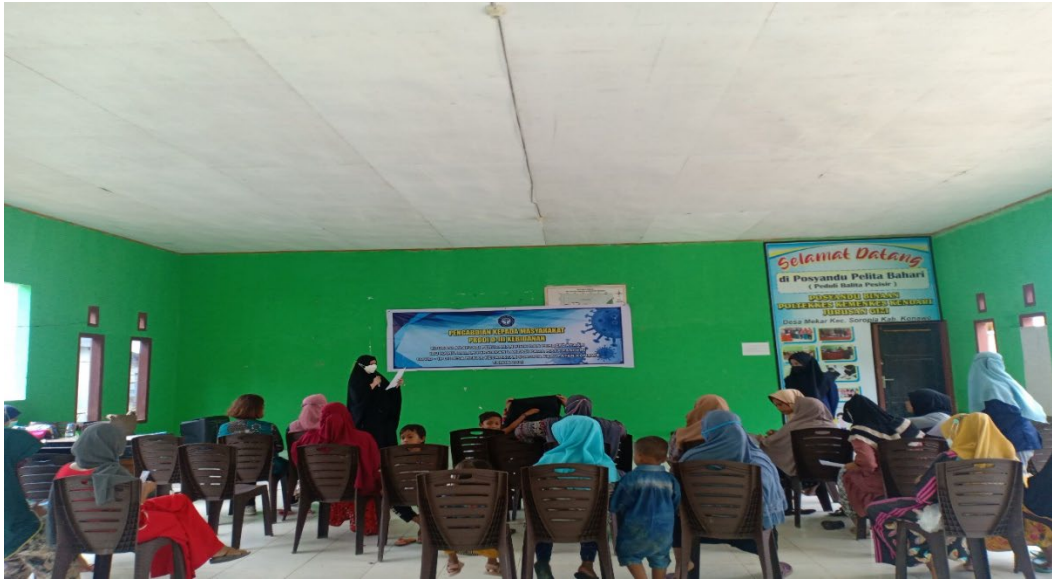
Gambar 3. Kegiatan pemberian edukasi perubahan fisik pada masa kehamilan