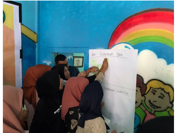
Gambar 3. Kegiatan Pretest dan Postest pelatihan