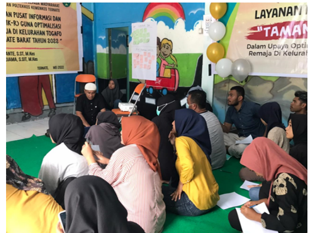
Gambar 6. Pendampingan dalam pengaplikasian layanan konsultasi online oleh Tim Teknologi Informasi