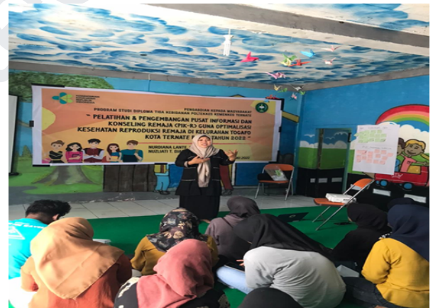
Gambar 4. Pemaparan Materi pada sesi pelatihan